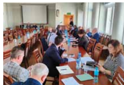
Komisja Samorządu Spółdzielczego i Promocji

spółdzielczych związków rewizyjnych. Dyskutowano także nad stworzeniem w Krajowej Radzie Spółdzielczej wspólnej ogólnodostępnej bazy danych w zakresie lustracji, lustratorów i ich szkoleń. □