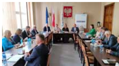
Komisja Prawa i Legislacji Spółdzielczej