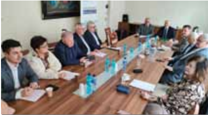
Komisja Finansów Spółdzielczych

Komisji byli jednomyślni, że dziś informacja rozprzestrzeniona się przede wszystkim w internecie i że należy dobrze wykorzystać ten kanał do popularyzacji spółdzielczości. Jednakże w pierwszej kolejności trzeba opracować koncepcję promocji, zastanowić się wspólnie - co chcemy promować i do kogo ten przekaz ma trafić. Do końca kwietnia br. członkowie Komisji mają przesyłać do Biura Zarządu KRS własne propozycje w zakresie popularyzowania spółdzielczości. □