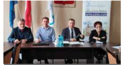
Komisja Spółdzielczości Rolniczej

Zadaniem Komisji będzie dążenie do zwiększenia obecności i widoczności spółdzielni różnych branż w ruchu ekonomii społecznej oraz zwiększenie konkurencyjności przedsiębiorstw spółdzielczych poprzez ułatwienie im dostępu do wsparcia dedykowanego przedsiębiorstwom społecznym. Członkowie Komisji zwracali uwagę, że spółdzielczość socjalna - będąca stosunkowo młodą branżą - jest mało znana także w spółdzielczym świecie i oceniana poprzez filtr stereotypów, jakie wiążą się z zatrudnieniem socjalnym. Ważnym aspektem będzie więc kształtowanie świadomości, popularyzacja i promocja dobrych praktyk. Może być w tym pomocna analiza danych statystycznych gromadzonych przez GUS, oraz zapraszanie na posiedzenia Komisji ekspertów z różnych dziedzin. □