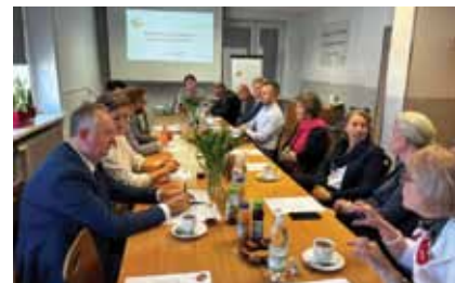
Posiedzenie Klubu Prezesa i Głównego Księgowego ZLSP w Rzeszowie