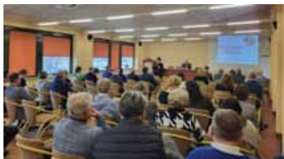
Posiedzenie Klubu Prezesa i Głównego Księgowego ZLSP w Krakowie

Związek Lustracyjny Spółdzielni powrócił do cyklicznego organizowania spotkań Klubów Prezesa i Głównego Księgowego. Zawsze cieszyły się one dużym zainteresowaniem, ponieważ są miejscem gdzie mogą spotykać się spółdzielnie różnych branż z danego regionu oraz przedsiębiorcy, samorządowcy, przedstawiciele lokalnych organizacji i świata nauki.