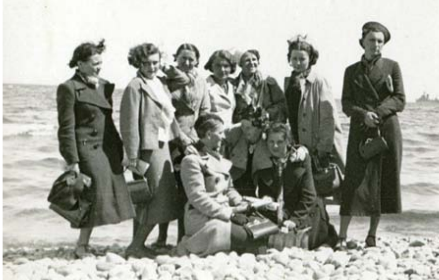
Członkinie Ligi Kooperatystek nad Bałtykiem, 1939 r.

W ostatnich dekadach XIX wieku wraz z rozwojem ruchów równouprawnienia, czy emancypacji kobiet, sufrażystek walczących o pełnię praw obywatelskich dla pań, zaktywizowały się również kooperatystki, a nawet odegrały tu pionierską rolę. Już w 1883 roku założona została w Wielkiej Brytanii Spółdzielcza Gildia Kobiet Anglii i Walii (Cooperative Women's Guild of England and Wales). Zajmowała się zrazu głównie sprawą cen towarów w spółdzielczych sklepach i nawet doprowadziła do ich obniżek w pewnych przypadkach. Przy poszczególnych kooperatywach powstawały filie Gildii zwane kołami, podejmujące działalność oświatową dla członkiń, zajęcia dla dzieci, organizujące czas wolny, udzielające zapomóg potrzebującym, prowadzące kluby dla kobiet, pralnie itp. Gildia promowała jednocześnie równouprawnienie płci w spółdzielniach, namawiała panie do wchodzenia do organów kierowniczych, prowadziła też szerszą akcję w kraju na rzecz pełnej