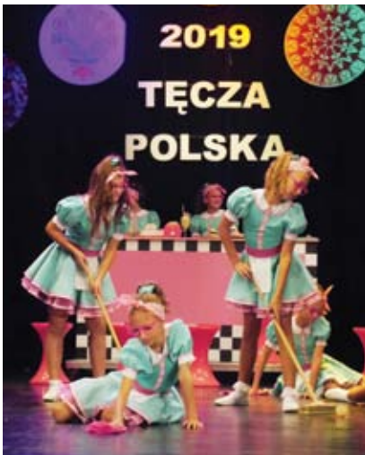
Zespół taneczny „Złote Dzieci” z Legnickiej Spółdzielni Mieszkaniowej

Osoby prowadzące spółdzielcze zespoły artystyczne mogą zadawać sobie pytanie - czy nasz zespół jest wystarczająco dobry, by wystąpić na Festiwalu? czy profil jego działalności jest odpowiedni?