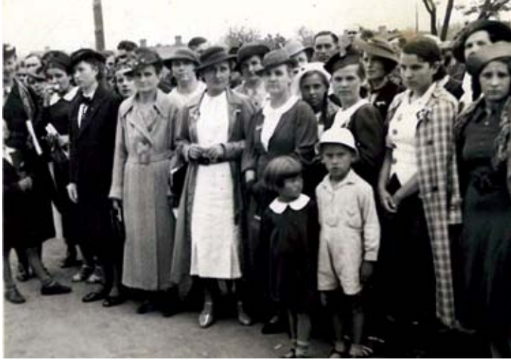
Koło Kooperatystek w Starachowicach, 1935 r.

I na ziemiach polskich pierwsze spółdzielnie tworzone były przez mężczyzn, dość wcześnie jednak, zwłaszcza w zaborze rosyjskim i austriackim pojawiły się aktywne kobiety-spółdzielczynie. Wiele z nich zresztą zasłużyło się również i na innych polach. Członkinią najstarszej polskiej spółdzielni spo-