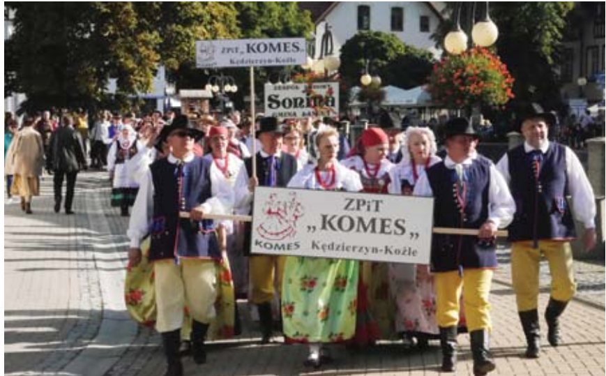
Parada zespołów na polanickim deptaku podczas XX Festiwalu Spółdzielczych Zespołów Artystycznych „Tęcza Polska” w październiku 2019 r.

Podczas Festiwalu mogą wystąpić artyści w każdym wieku: zapraszamy zarówno śpiewacze zespoły senioralne, jak i zespoły dziecięce, wokalistów, tancerzy, orkiestry oraz grupy teatralne - ważne, aby były związane ze spółdzielczością. Zespół powinien opracować 15-minutowy występ (w przypadku grup teatralnych 25 minutowy) i zaprezentować go podczas dwóch pierwszych dni konkursowych zgodnie z programem Festiwa-