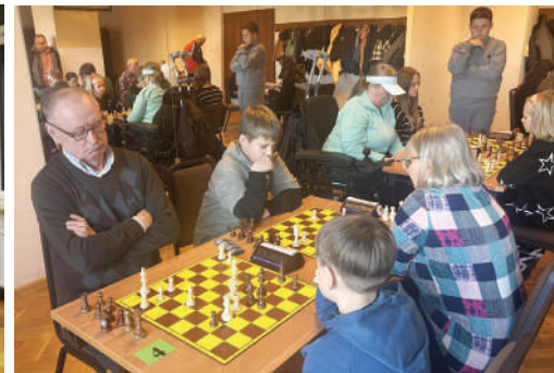
Memoriał Zbigniewa Szporoko, listopad 2025.