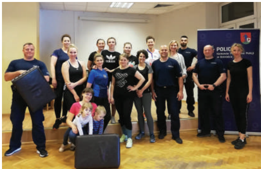
Zajęcia z samoobrony dla kobiet „Obroń się sama” prowadzone przez policjantów z KPP Ostródza.