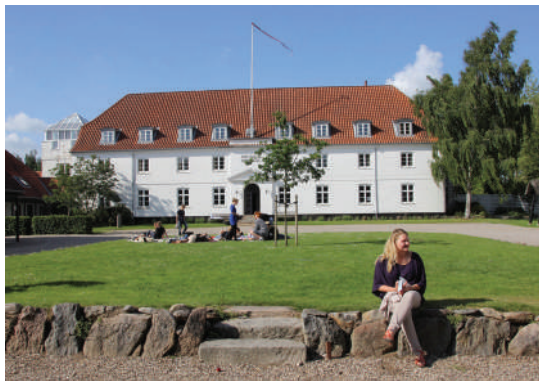
Pierwszy uniwersytet ludowy na świecie - Rødding Højskole, powstała w 1844.