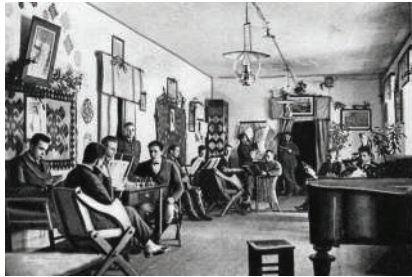
Świątelnia Uniwersytetu Ludowego im. Władysława Orkana w Szycach