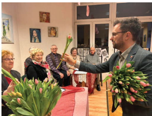
Zyczenia i kwiaty dla Pań z okazji 8 marca przekazał Burmistrz Ostródy Rafał Dąbrowski, na spotkaniu w ODK SM „Jedność”.

a do współpracy zapraszają kilkunastu instruktorów - część z nich to wolontariusze, część prowadzi własne firmy, a w ODK wynajmuje sale na zajęcia. Dzięki temu oferta jest bardzo urozmaicona i w znacznej części bezpłatna. Zarząd zdecydował, że dom kultury będzie otwarty dla wszystkich, także dla osób spoza Spółdzielni. Członkowie SM „Jedność” nie ponoszą dodatkowych kosztów w postaci odpisu na działalność społeczno-kulturalną. Całość finansowana jest ze środków własnych Spółdzielni i ze wsparcia sponsorów, którzy chętnie angażują się w inicjatywy ODK.